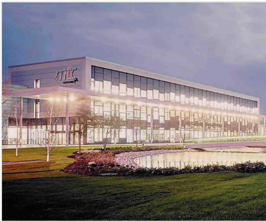
A Coventry. Il Manufacturing Technology Center di Coventry - Mtc - è stato aperto nel 2011 da sedici imprese fondatrici. Adesso, le aziende sono diventate un centinaio