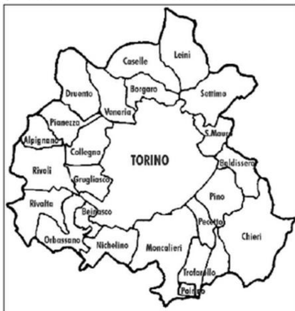
In quella sede, i 314 sindaci del torinese avviseranno il confronto con la Provincia e la città di Torino, finalizzato alla costituzione della città metropolitana.

"Un passaggio indispensabile perché sappiamo bene che il vasto territorio abbia la necessità di sentirsi rappresentato e coinvolto in questa scommessa che è la costituzione della Città metropolitana" spiegano il sindaco di Torino, Piero Fassino – a cui la legge affida il compito di Presidente della Città Metropolitana – ed il vicepresidente della Provincia di Torino, Alberto Avetta, che questa mattina si sono incontrati a Palazzo Cisterna per condividere le modalità di avvio del nuovo ente.