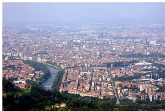
Torino Città Metropolitana è al centro di una serie di incontri e appuntamenti. Il prossimo in agenda è fissato per il prossimo 15 luglio alle 09.30 nell'aulitorium della sede della Provincia in Corso Ingilterra.